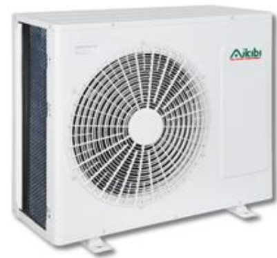
MODEL: AW18C / 24C

Quạt được thiết kế tối ưu nên cải thiện được vấn đề gió ra, làm giảm độ ồn và nâng cao hiệu suất.