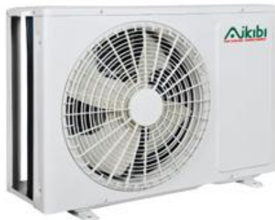
MODEL: AW09C / 12C

Quạt được thiết kế tối ưu nên cải thiện được vấn đề gió ra, làm giảm độ ồn và nâng cao hiệu suất.